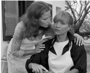
1980 LE SOLEIL EN FACE de Pierre Kast avec Stéphane Audran