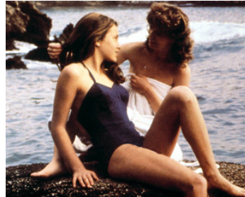
1978 LA PETITE FILLE EN VELOURS BLEU d'Alan Bridges avec Lara Wendel