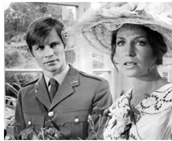
1971 ZEPPELIN (Zeppelin) d'Étienne Périer avec Michael York