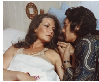
1971 LES SOLEILS DE L'ÎLE DE PÂQUES de Pierre Kast avec Jacques Charrier