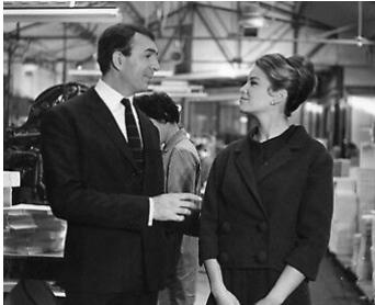
1962 CLIMATS de Stelio Lorenzi avec Jean-Pierre Marielle