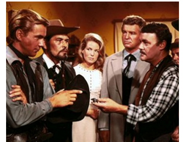
1965 ON L'APPELLE GRINGO (Sie nannten ihn Gringo) de Roy Rowland avec Götz George