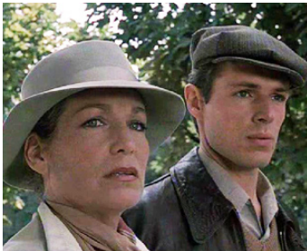
1984 LE SANG DES AUTRES de Claude Chabrol avec Lambert Wilson