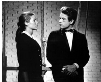
1964 MICKEY ONE (Mickey One) d'Arthur Penn avec Warren Beatty