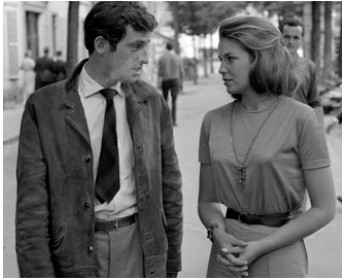
1960 LES DISTRACTIONS de Jacques Dupont avec Jean-Paul Belmondo