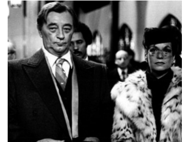
1980 LES ESPIONS DANS LA VILLE (Agency) de George Kaczender avec Robert Mitchum