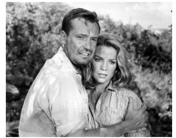
1960 TARZAN LE MAGNIFIQUE (Tarzan the Magnificent) de Robert Day avec Ch. Tingwell