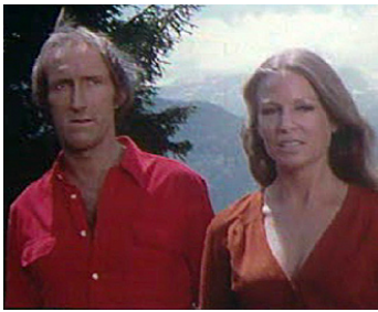
1971 OÙ EST PASSÉ TOM ? de José Giovanni avec Rufus