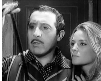
1963 DRAGÉES AU POIVRE de Jacques Baratier avec Romolo Valli