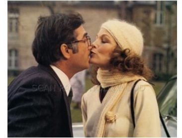
1976 JULIE POT-DE-COLLE de Philippe de Broca avec Jean-Claude Brialy