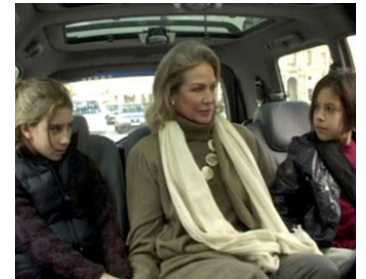
2002 LES FILLES, PERSONNE S'EN MÉFIE de Charlotte Silveira