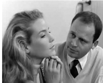
1962 ROGOPAG, Le nouveau Monde de Jean-Luc Godard avec Jean-Marc Bory