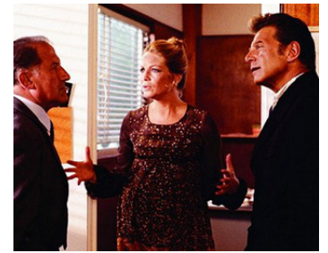
1973 LA NUIT AMÉRICAINE de François Truffaut avec Jean Champion, Jean-Pierre Aumont