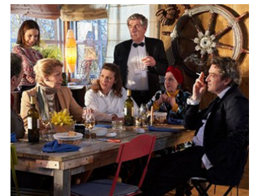
2019 À CAUSE DES FILLES...? de Pascal Thomas avec Barbara Schulz, L.D. de Lencquesaing