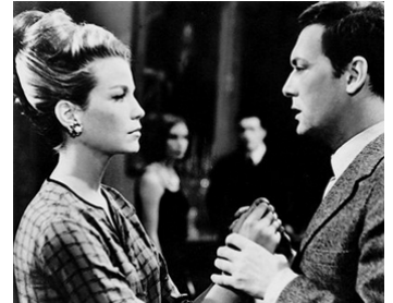
1963 LE FEU FOLLET de Louis Malle avec Maurice Ronet