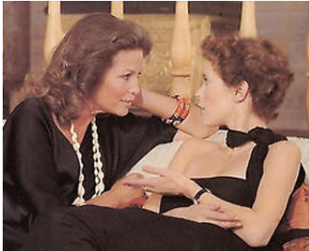
1978 GOOD-BYE, EMMANUELLE de François Leterrier avec Sylvia Kristel