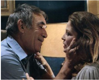
1974 MARSEILLE CONTRAT (The Marseille Contract) de Robert Parrish avec Anthony Quinn