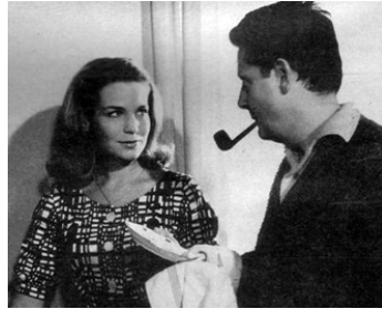
1960 LA MORT DE BELLE d'Édouard Molinaro avec Jean Desailly