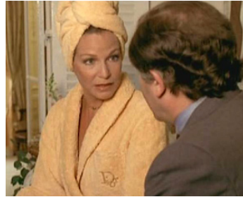
1981 MADAME CLAUDE 2 de François Mimet avec Bernard Fresson