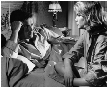
1959 L'EAU À LA BOUCHE de Jacques Doniol-Valcroze avec Jacques Riberolles