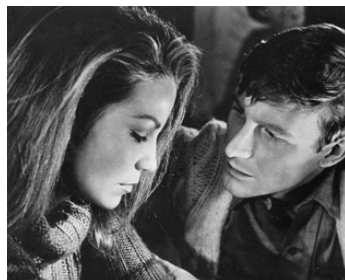
1969 LES 2 AMOURS DE CAROLINE (Waiting for Caroline) de Ron Kelly avec Fr. Tassé