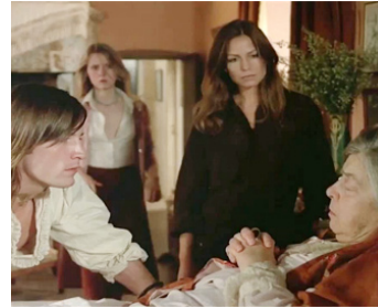
1975 BLACK MOON de Louis Malle avec Joe Dallessandro, Th. Giehse, Cathryn Harrison