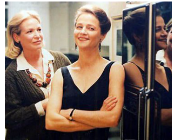
2000 SOUS LE SABLE de François Ozon avec Charlotte Rampling