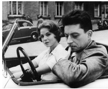
1960 LE BEL ÂGE de Pierre Kast avec Jacques Doniol-Valcroze