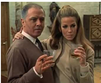
1968 TRIO D'ESCROCS (Only When I Lurf) de Basil Dearden avec Richard Attenborough