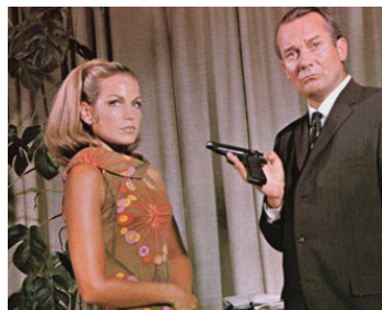
1967 MAROC 7 (Maroc 7) de Gerry O'Hara avec Denholm Elliott