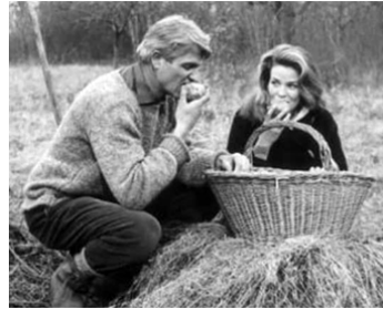
1961 LES MAUVAIS COUPS de François Leterrier avec Reginald Kerner