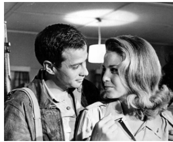
1960 EXODUS (Exodus) d'Otto Preminger avec Michael Wager