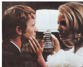
1969 BYE-BYE BARBARA de Michel Deville avec Philippe Avron