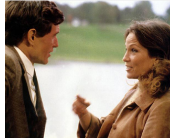
1978 LES FEMMES DE 30 ANS (In praise of older women) de G. Kaczender avec Tom Berenger