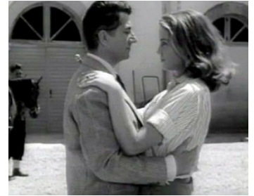
1961 LA MORTE-SAISON DES AMOURS de Pierre Kast avec Daniel Gélin